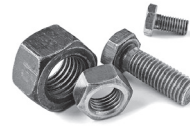
для DN40-600 от 4 до 20 шт.