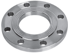
FF20-XXX 2 шт.