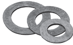
Прокладка паронитовая XXX 2 шт.