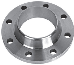
FF21-XXX 2 шт.